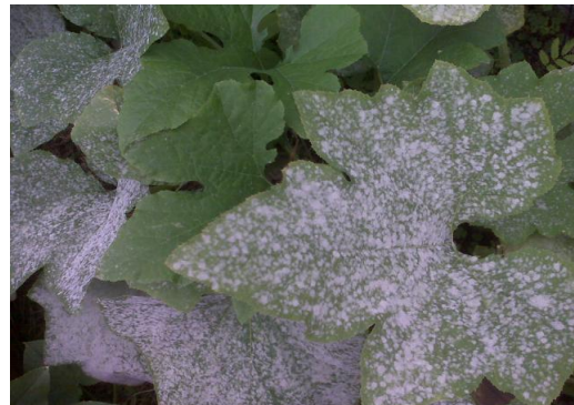
อาการที่ใบ