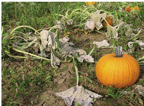
อาการรุนแรง