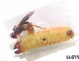
มวนเพศฆฆาต