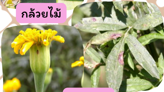
ดาวเรือง