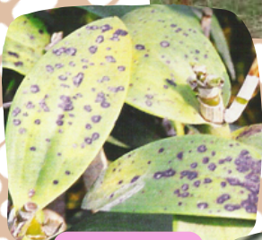
กล้วยไม้