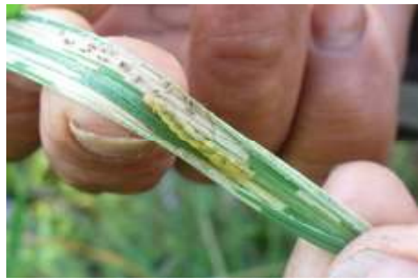
ลักษณะการทำลายของหนอนห่อใบข้าว