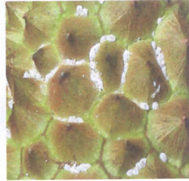
ลักษณะการทำลายของเพลี้ยแป้งในทุเรียน