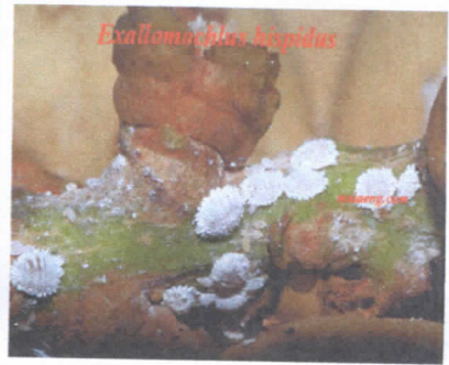
ลักษณะการทำลายของเพลี้ยแป้งในเงาะและลองกอง