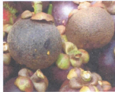
ลักษณะอาการของมังคุดที่ถูกเพลี้ยไฟทำลาย