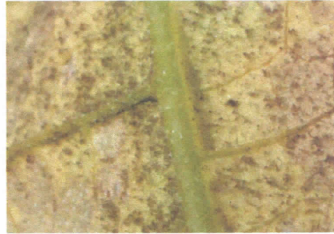
ลักษณะของเชื้อรา Pseudoperonospora cubensis