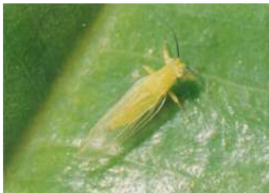
ระยะตัวเต็มวัยของเพลี้ยไก่อแจ้