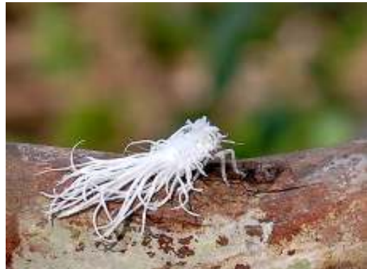
ระยะตัวอ่อนของเพลี้ยไก่อแจ้