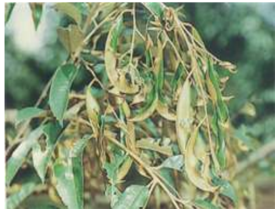
อาการของใบทุเรียนที่ถูกเพลี้ยไก่แจ้ทำลาย