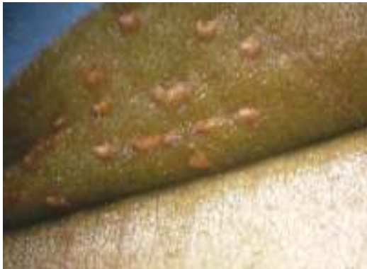
ระยะไข่ของเพลี้ยไก่อแจ้

เพลี้ยไก่อแจ้ (Durian psyllid) มีชื่อวิทยาศาสตร์ว่า Allocaridara malayensis Crawford ตัวเต็มวัยของแมลงชนิดนี้วางไข่เข้าไปในเนื้อเยื่อพืช ทำให้เห็นเป็นวงสีเหลืองหรือน้ำตาลตามใบเป็นกลุ่มๆ กลุ่มหนึ่งมีประมาณ 8-14 ฟอง หลังจากนั้นไข่จะฟักออกเป็นตัวอ่อนขนาดยาวประมาณ 3 มิลลิเมตร และมีปุยสีขาวติดอยู่ตามลำตัว โดยเฉพาะด้านท้ายของลำตัวมีปุยสีขาวคล้ายๆ กับหางไก่อแจ้ แมลงชนิดนี้จึงได้ชื่อว่า "เพลี้ยไก่อแจ้" หรือ "เพลี้ยไก่อฟ้า" เมื่อแมลงนี้ลอกคราบเป็นตัวเต็มวัยมีสีน้ำตาลปนเขียว ขนาดยาวประมาณ 5 มิลลิเมตร มีอายุได้นานถึง 6 เดือน มักไม่ค่อยบินนอกจากได้รับความกระทบกระเทือน ทั้งตัวอ่อนและตัวเต็มวัยจะอาศัยอยู่ด้านหลังใบตลอดเวลา