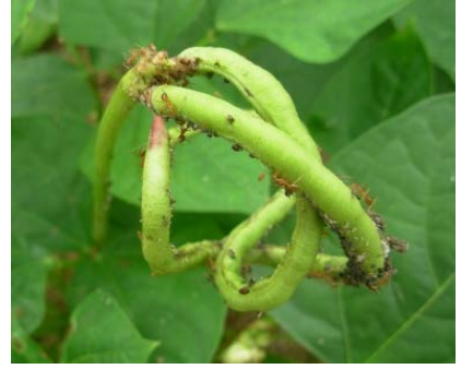
ลักษณะของพืชที่ถูกเพลี้ยอ่อนทำลาย