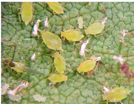
เพลี้ยอ่อนฝ้าย

เพลี้ยอ่อนทั้งตัวอ่อนและตัวเต็มวัยจะดูดกินน้ำเลี้ยงตามใบ ยอดอ่อน และดอกทำให้หงิกงอเป็นคลื่น หากมีการระบาดมากๆ จะทำให้ต้นชะงักการเจริญเติบโตอย่างรวดเร็ว ให้ผลผลิตลดลง คุณภาพผลผลิตต่ำ หรือไม่ได้ผลผลิตเลย บริเวณที่มีเพลี้ยอ่อนระบาดมักจะมีมดอาศัยกินน้ำหวานที่เพลี้ยอ่อนถ่ายออกมาซึ่งทำให้เกิดราดำ นอกจากนี้ยังเป็นพาหะนำไวรัสมาสู่พืชทำให้เกิดโรคใบด่าง (Mosaic) ซึ่งเป็นโรคของใบที่สำคัญมากของถั่วฝักยาว มีมดเป็นตัวนำพา มา จึงควรหาทางกำจัดมดไม่ให้เข้าไปในแปลงปลูกถั่ว