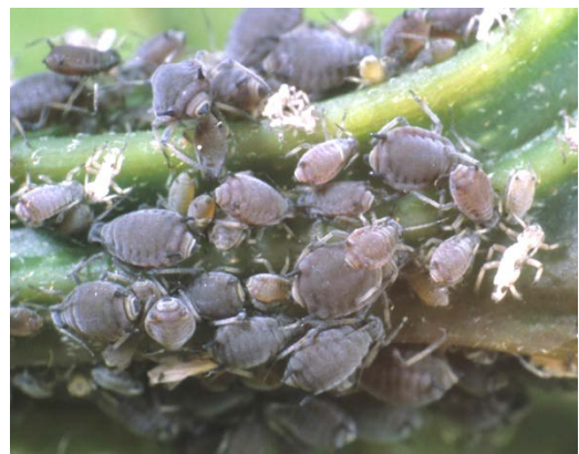
เพลี้ยอ่อนดำถั่ว