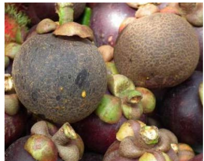
ลักษณะอาการของมังคุดที่ถูกเพลี้ยไฟทำลาย