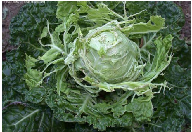
ลักษณะการทำลายของหนอนใยผัก