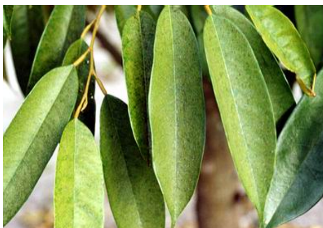
ลักษณะใบที่ถูกทำลาย