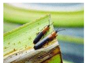
ตัวเต็มวัย