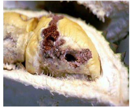
ลักษณะการทำลายของหนอนเจาะเมล็ดทุเรียน