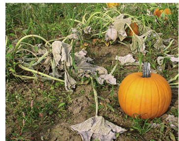
อาการรุนแรง