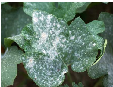
อาการที่ใบ