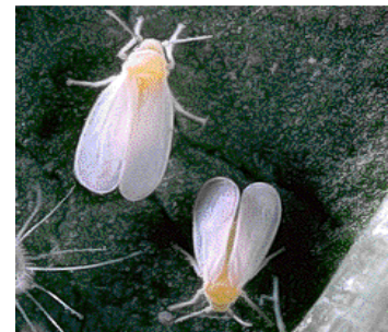
ตัวเต็มวัย