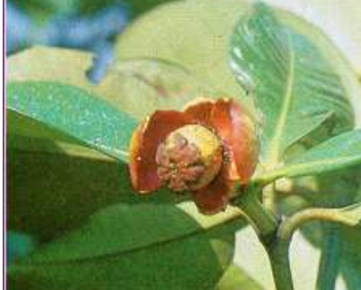
ลักษณะของผลมังคุดที่ถูกเพลิงไฟทำลาย