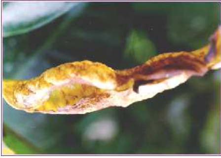
ลักษณะของใบที่ถูกเพลิงไฟทำลาย