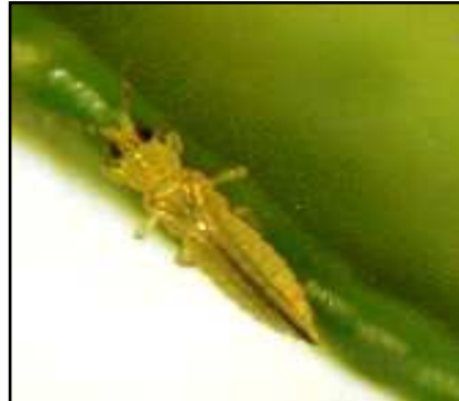
ตัวเต็มวัยของเพลี้ยไฟ