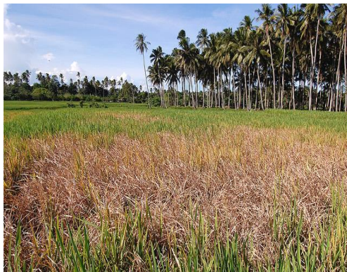
อาการไหม้ของต้นข้าว (hopperburn)