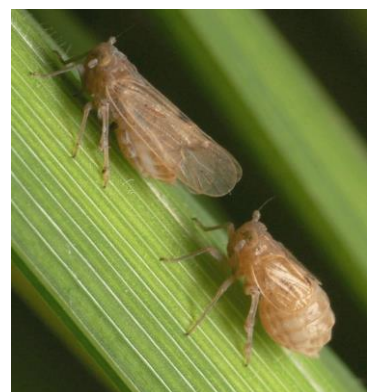
ตัวเต็มวัย