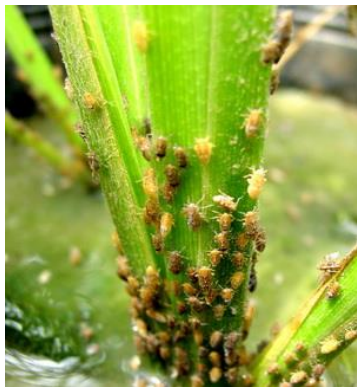
การระบาดของรุนแรงในนาข้าว

เพลี้ยกระโดดสีน้ำตาลทั้งตัวอ่อน และตัวเต็มวัยทำลายข้าว โดยการดูดกินน้ำเลี้ยง จากเซลล์ที่อ่อน้ำท่ออาหาร บริเวณโคนต้นข้าว ระดับเหนือผิวน้ำ ทำให้ต้นข้าว มีอาการใบเหลืองแห้ง ลักษณะคล้ายถูกน้ำร้อนลวก แห้งตายเป็นหย่อมๆเรียก “อาการไหม้ (hopperburn)” โดยทั่วไปพบอาการไหม้ในระยะข้าวแตกกอถึงระยะออกรวง ซึ่งตรงกับช่วงอายุชั้ยที่ ๒-๓ (generation) ของเพลี้ยกระโดดสีน้ำตาลในนาข้าว ที่ขาดน้ำ ตัวอ่อนจะลงมาอยู่ที่บริเวณโคนกอข้าว หรือบนพื้นดินที่แฉะมีความชื้น นอกจากนี้เพลี้ยกระโดดสีน้ำตาล ยังเป็นพาหะนำเชื้อไวรัสโรควง (rice ragged stunt) มาสู่ต้นข้าวทำให้ต้นข้าวมีอาการแคระแกร็น ต้นเตี้ย ใบสีเขียว แคบและสั้น ใบแก่ช้ากว่าปกติ ปลายใบบิด เป็นเกลียว และ ขอบใบแห้งวิน