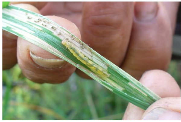
ลักษณะการทำลายของหนอนห่อใบข้าว