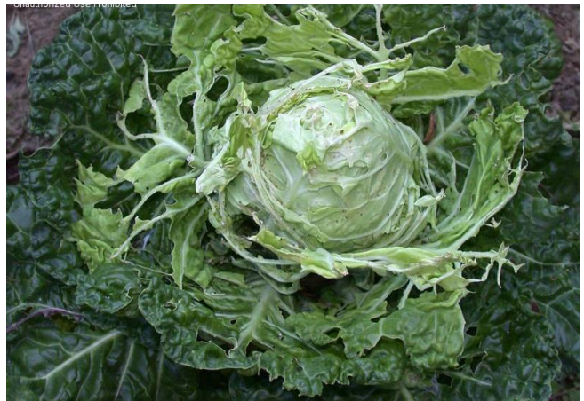
ลักษณะการทำลายของหนอนใยผัก