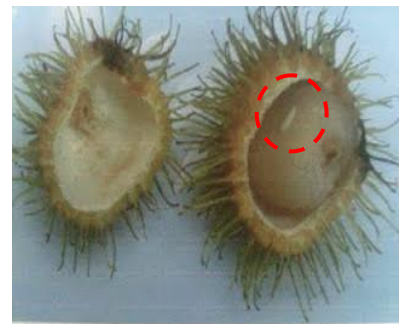
ลักษณะการทำลายของแมลงวันผลไม้